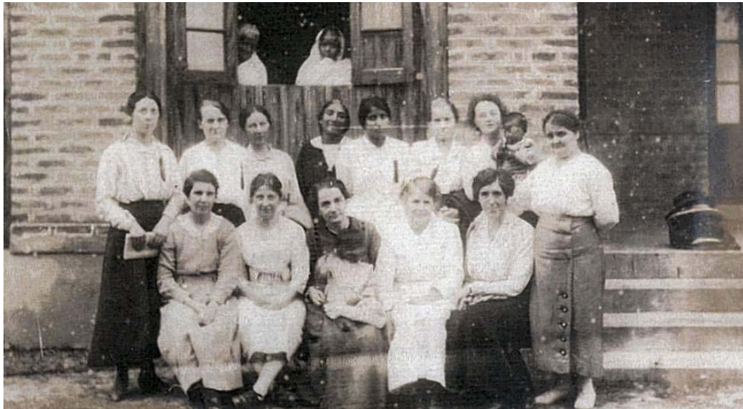
Ffigwr 3: Ysbyty'r Menywod, Habiganj, 31 Rhagfyr 1920