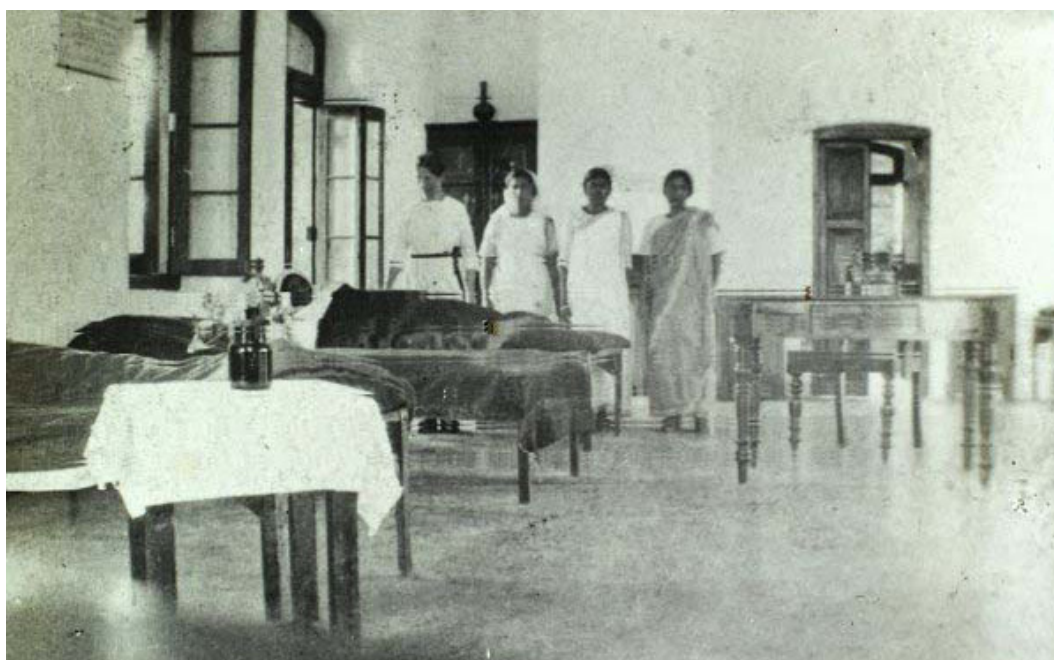
Figwr 4: Ysbyty'r Menywod, Habiganj, c. 1925

In spite of drawbacks the work done is splendid, and this is a most deserving charity as the work lies mainly amongst poor women who come from all parts, and who otherwise would have to do without treatment. The operating theatre is an extremely nice apartment. 88