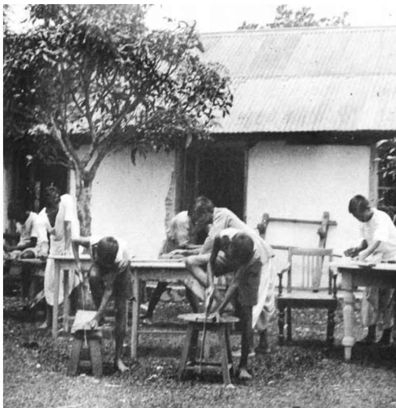
Ffigwr 6: Ysgol Ddiwydiannol Sylhet – y saeri coed, c. 1930 Tryloywllun hudlusern, AMC 20612, blwch 11/18, 27 (25)