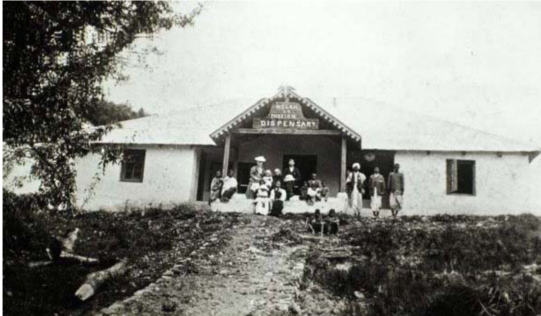
Ffigwr 1: Fferyllfa Jowai c. 1905. Tryloywllun hudlusern AMC 20612, blwch 13/18, 28 (-)

Agorwyd y fferyllfa gyntaf yn Sylhet ym 1863, a hynny gan y cenhadwr Cymreig, William Pryse. Erbyn 1881, toc ar ôl i'r genhadaeth ailgydio ei phresenoldeb yn y ddinas, cynyddodd y nifer i bedwar. Neidiodd y nifer hwnnw i 34 ym 1892 wrth i'r genhadaeth ymestyn ei hystod gwasanaethol yno, ac yna i 43 ym 1901.