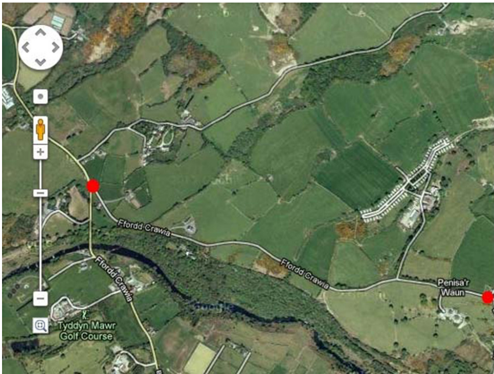
Figur 2 Ffordd Crawia Fach, rhwng y ddau smoty