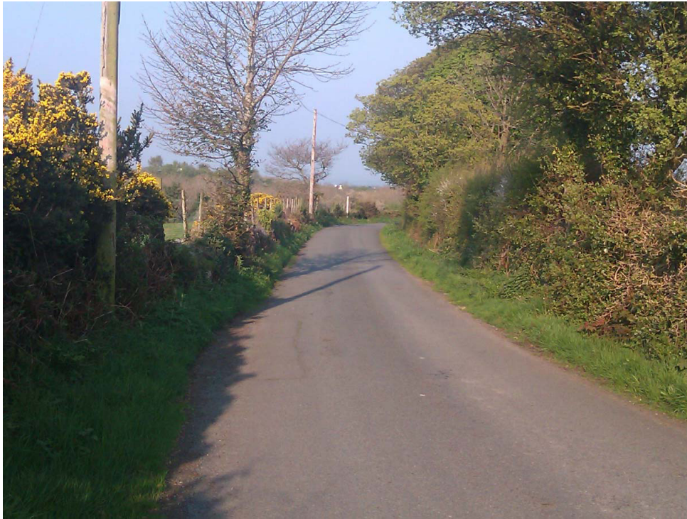
Figur 1 Ffordd Crawia Fach, 19 Ebrill 2011