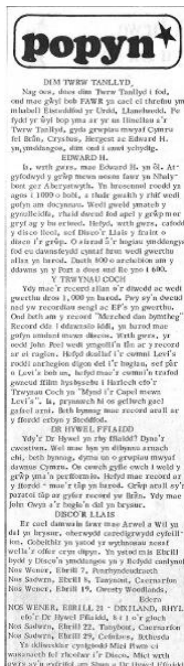
Figur 1: Enghraifft o golofn 'Popyn', Llais Ogwan (Rhif 43 (Ebrill 1978))